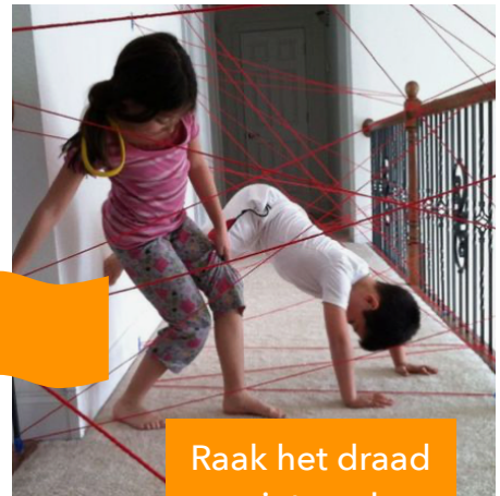
Raak het draad niet aan!