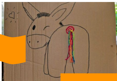
Ezeltje Prik Je