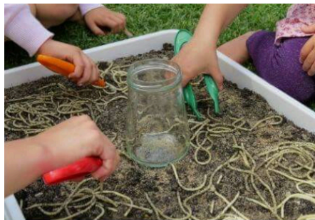
Digging for Spaghetti Worms

Vul de kunststof bak met zand. Kook de spaghetti en doe de gekookte slierten bij het zand. Hussel alles even goed door elkaar. Laat de kinderen met de tangen de 'wormen' vangen.